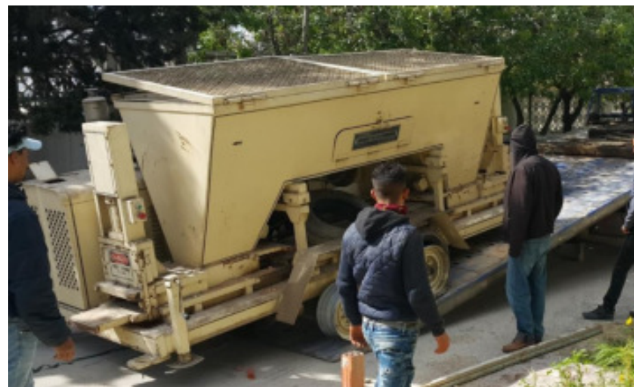
Acquisition d'une machine 2018 [Rendement : 500 BTCS /heure]