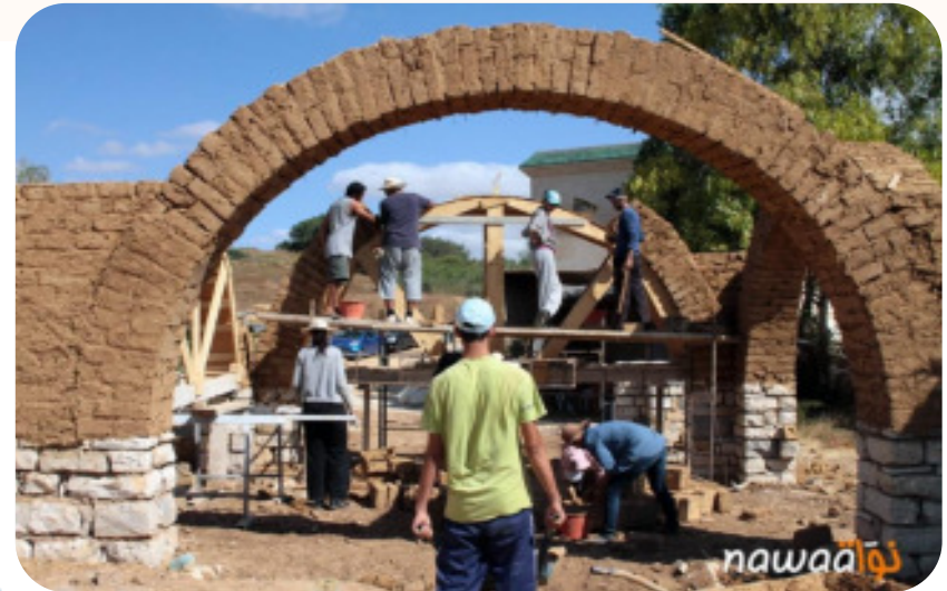
Workshop Adobe 2012