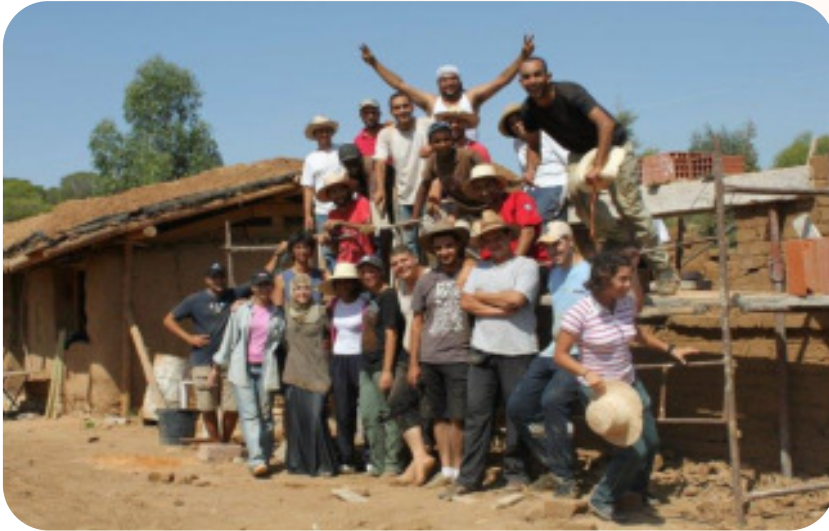
Workshop BTC 2011