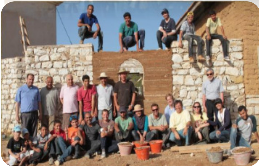
Workshop Pisé 2014