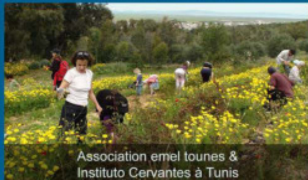
Association emel tounes & Instituto Cervantes à Tunis