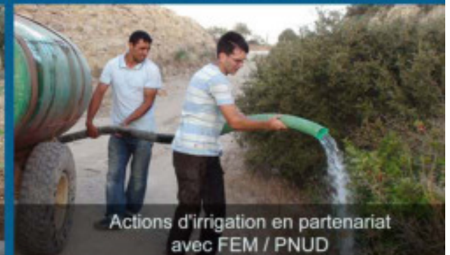
Actions d'irrigation en partenariat avec FEM / PNUD