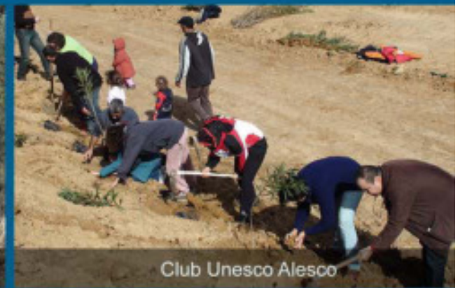
Club Unesco Alesco