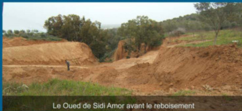
Le Oued de Sidi Amor avant le reboisement