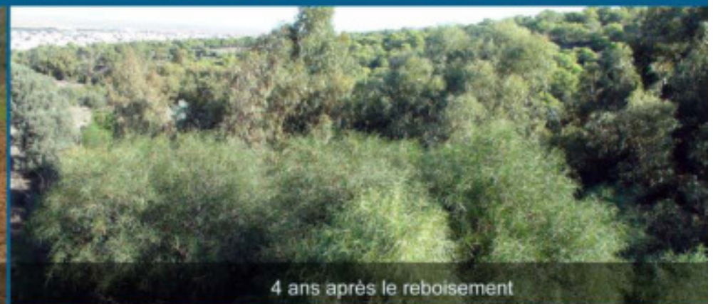
4 ans après le reboisement