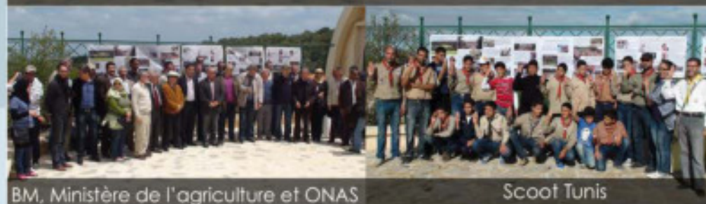
BM, Ministère de l'agriculture et ONAS