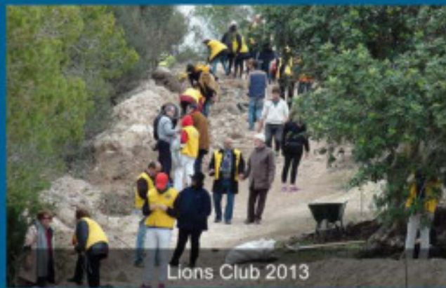
Lions Club 2013