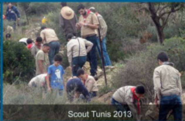
Scout Tunis 2013