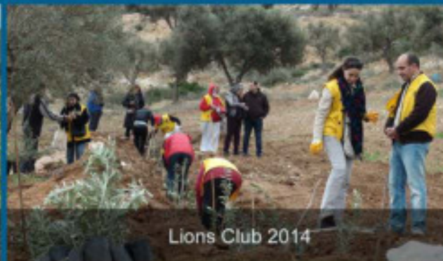
Lions Club 2014