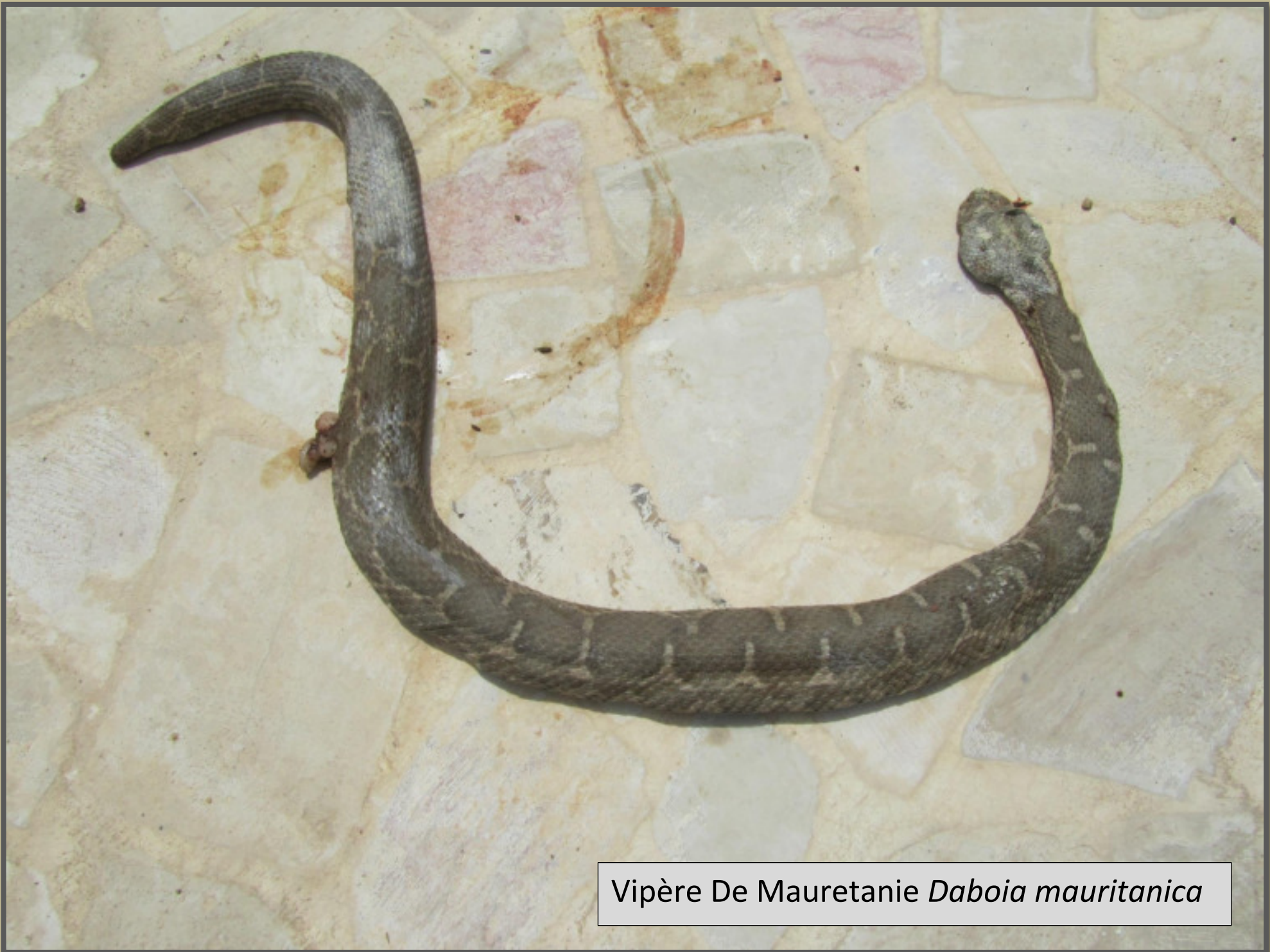
Vipère De Mauretanie Daboia mauritanica