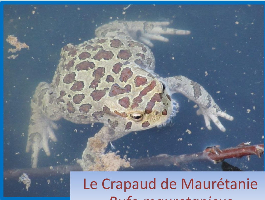
Le Crapaud de Maurétanie Bufo mauretanicus