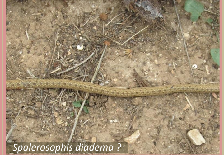
Spalerosophis diadema ?