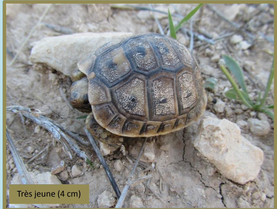
Très jeune (4 cm)