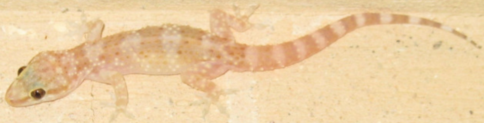
Le Gecko nocturne Hemidactylus turcicus