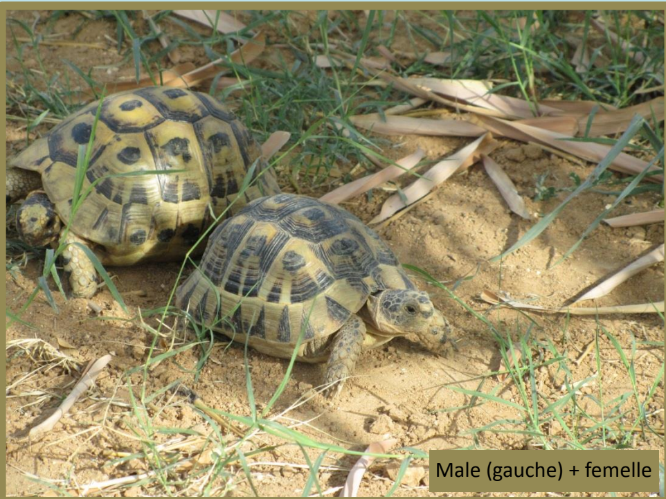
Male (gauche) + femelle