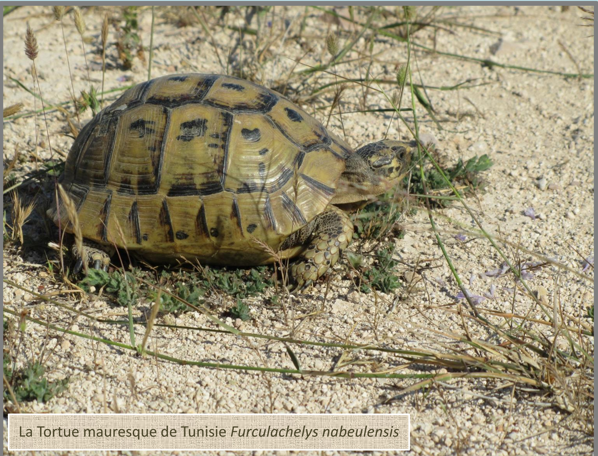
La Tortue mauresque de Tunisie Furculachelys nabeulensis