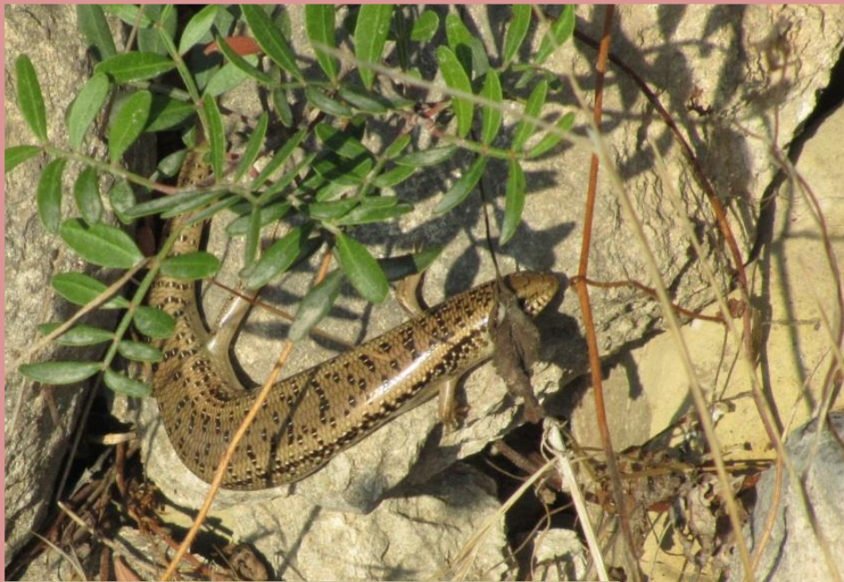
Le Scinque ocellé Chalcides ocellatus