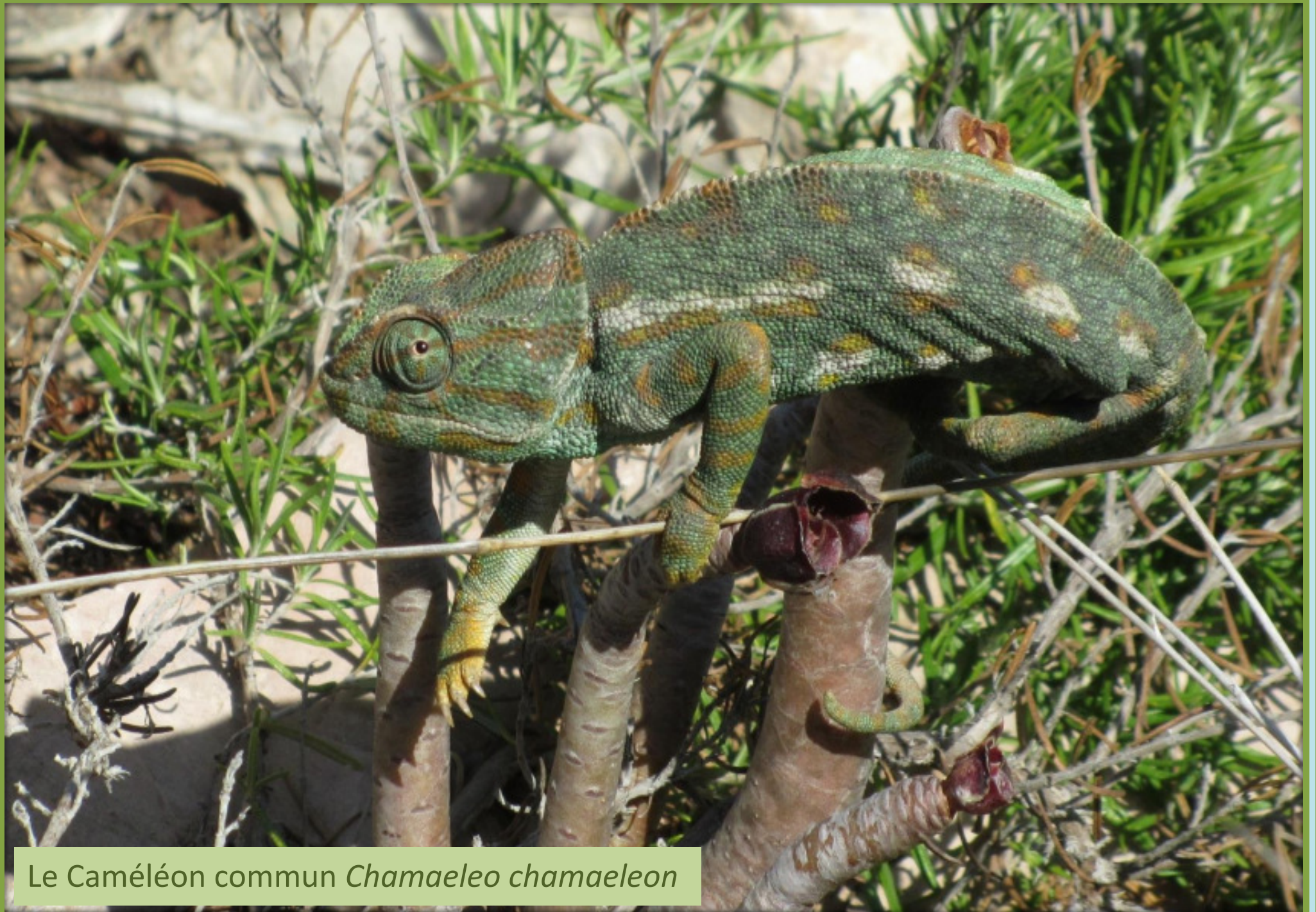
Le Caméléon commun Chamaeleo chamaeleon