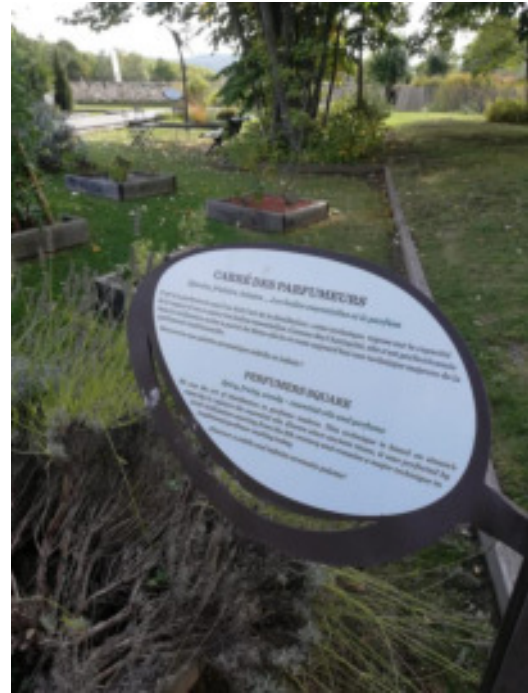
Une signalétique toujours adaptée à une pédagogie pour tous âges