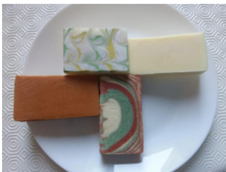
Exemple des savons réalisés lors du stage où l'on peut voir les différentes techniques apprises et utilisées