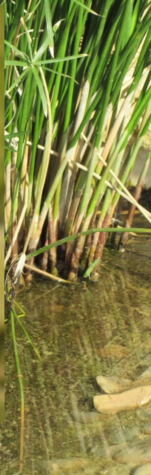
La Libellule écarlate Crocothemis erythraea ( ♂ )