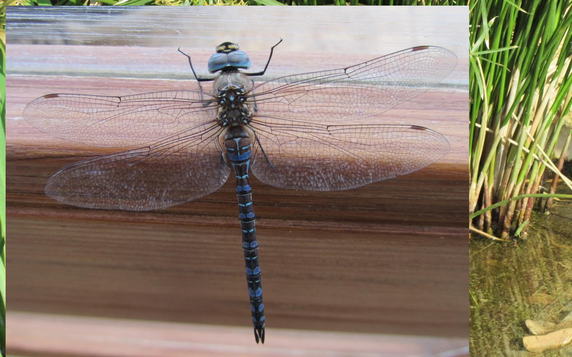
L'Æschne mixte Aeshna mixta ( ♂ )