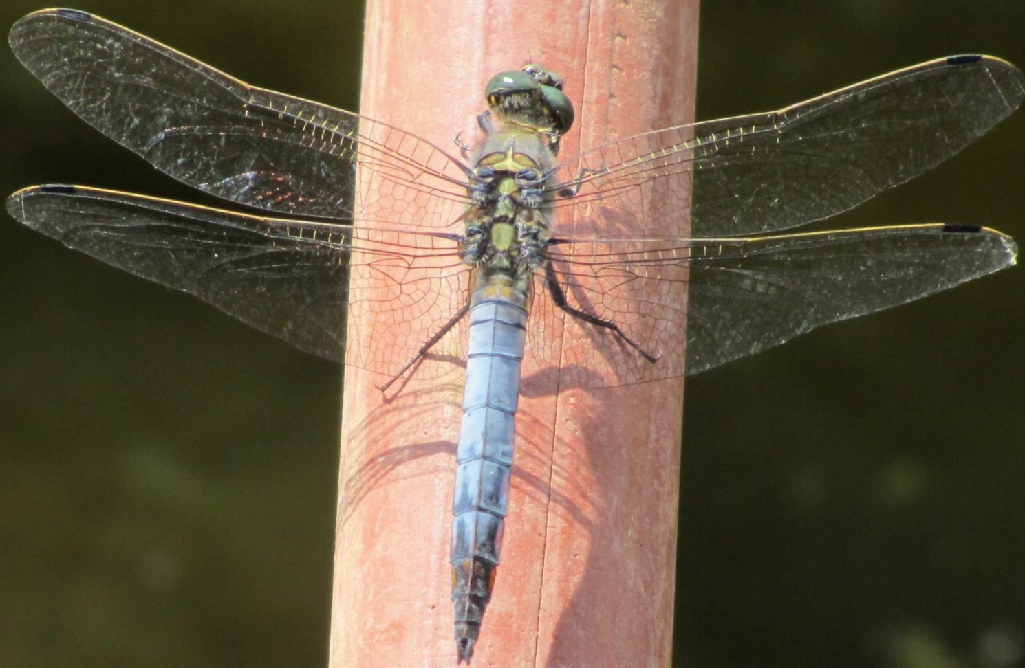
L'Orthétrum réticulé Orthetrum cancellatum ( ♂ )