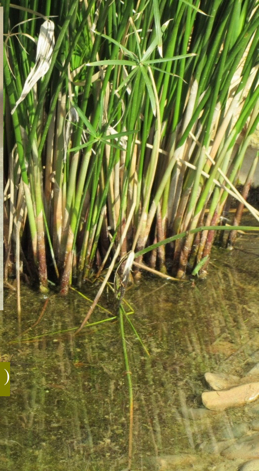
La Naiade aux yeux bleus Erythromma lindennii ( ♀ )