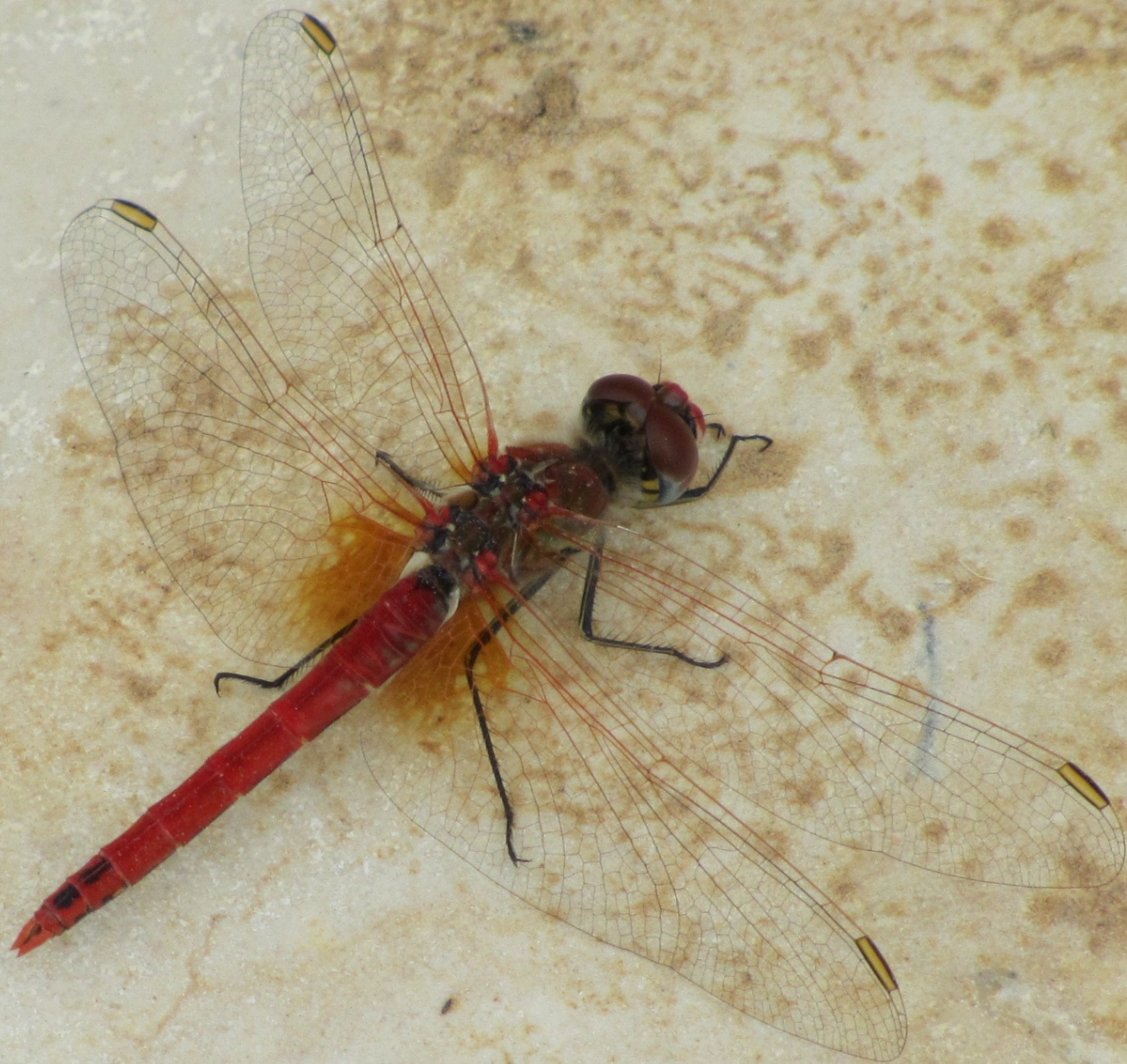
Trithemis arteriosa ( ♂ )