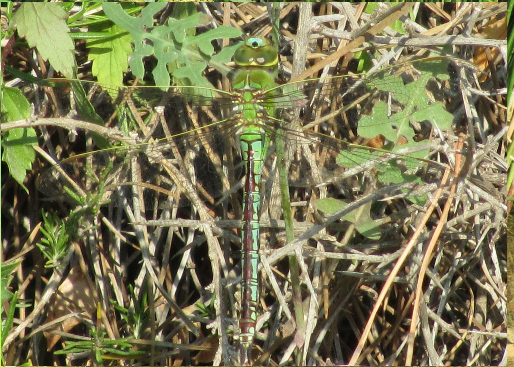
L'Anax empereur Anax imperator (♀)