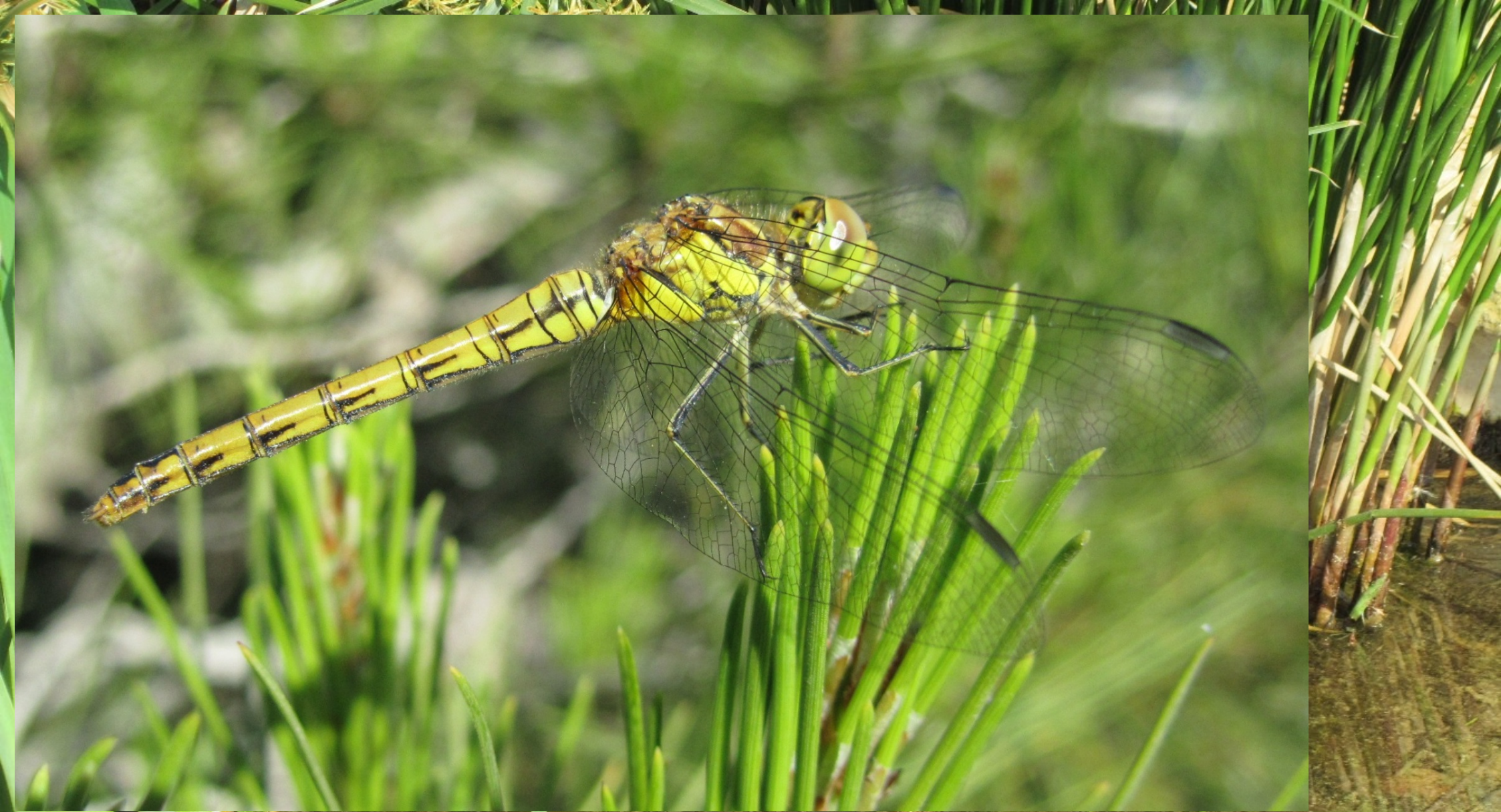
Sympetrum striolatum (♀)